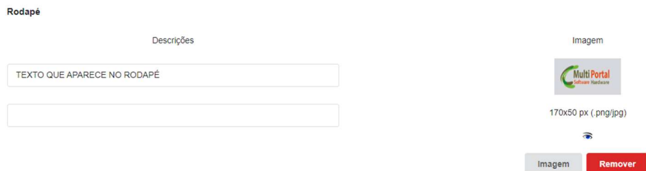
Imagem - Essa imagem precisa ter 170x50px e ser no formato PNG ou JPG .

Após preenchido os campos, clique em Salvar , agora já está disponível o layout para ser usado nos relatórios da plataforma.